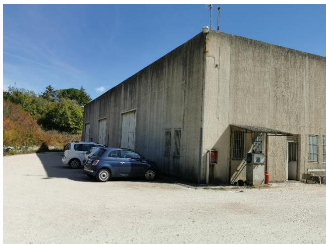
Ripresa fotografica lato ingresso