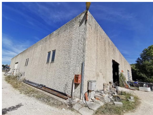
Ripresa fotografica del retro