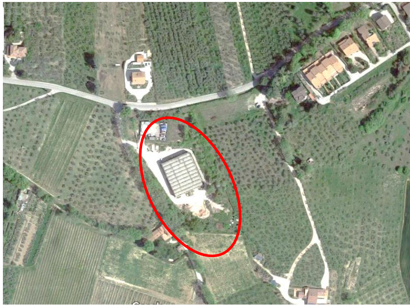
Vista aerea ravvicinata