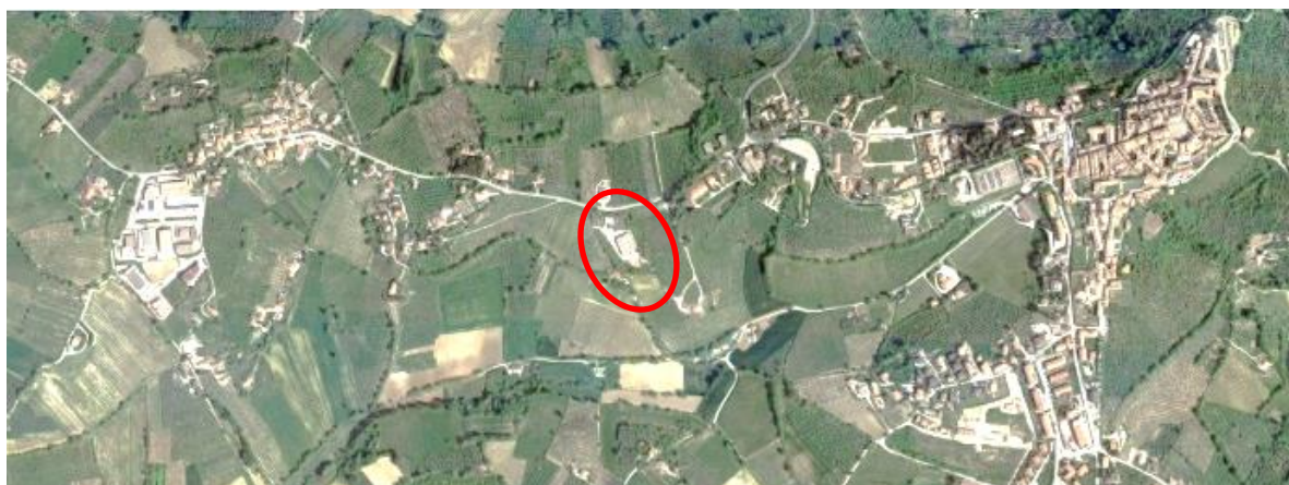
Vista aerea d'insieme