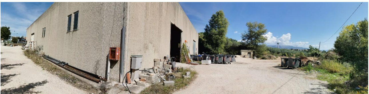
Vista panoramica dell'insediamento