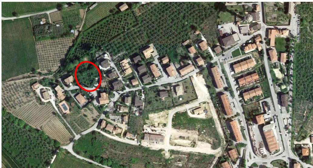
Vista aerea d'insieme

filename: immobile 5 area edificabile via leopardi