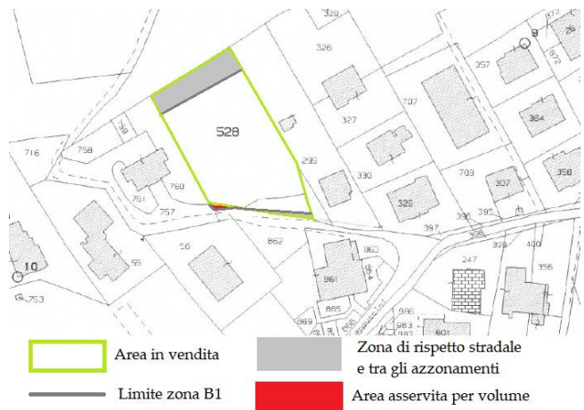
Stralcio Foglio di mappa 28 C. T.