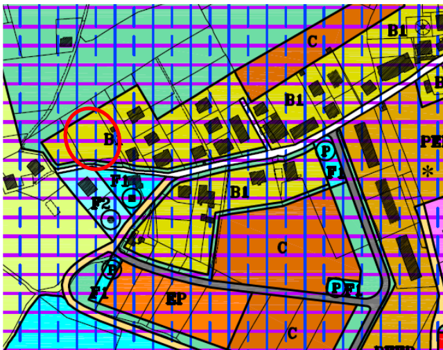
Stralcio Tav. 1/D del P. di F. vigente