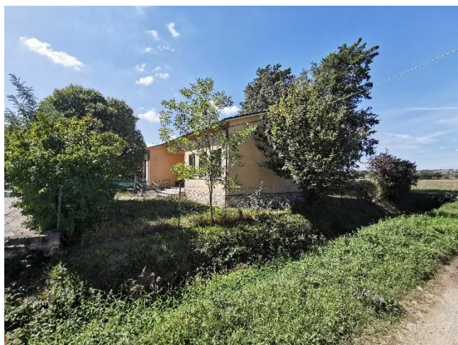
Ripresa fotografica del lato destro