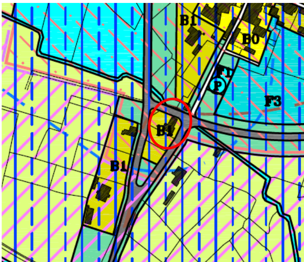
Stralcio Tav. 1/F del P. di F. vigente