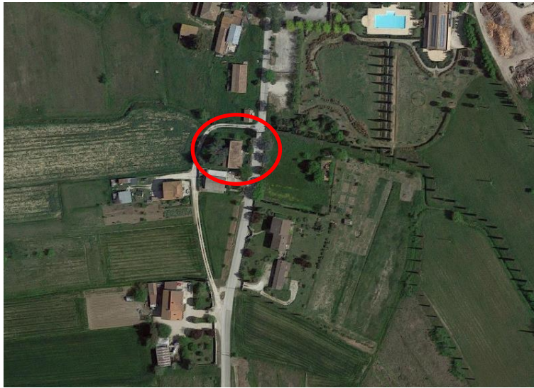
Vista aerea ravvicinata