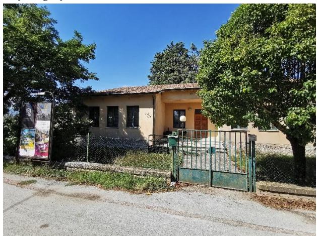
Ripresa fotografica del fronte su strada