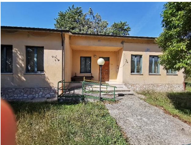
Ripresa fotografica dell'ingresso