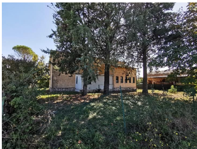
Ripresa fotografica del retro