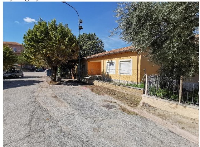
Ripresa fotografica del fronte strada