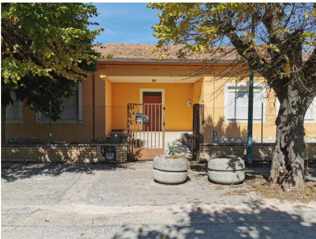
Ripresa fotografica dell'ingresso