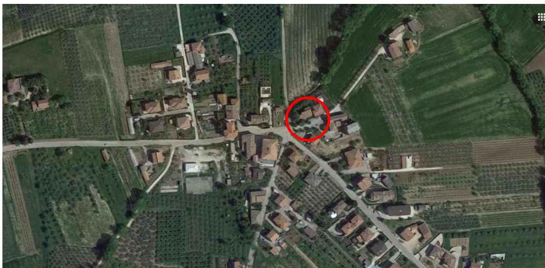
Vista aerea d'insieme