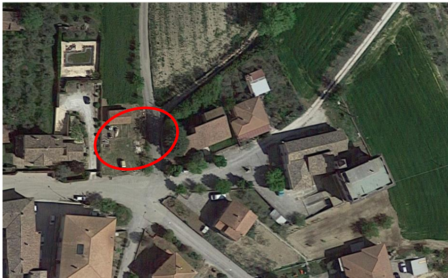
Vista aerea ravvicinata